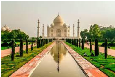
Fotografía con simetría axial izquierda derecha.

El módulo de una composición es la medida que nos da dividir un lado del recuadro de la obra entre el otro. M (módulo)= a/b . Podría ser el número de oro.